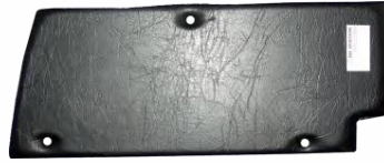
٥٣٢٠٥٠٥٣٠٢٠٢٦ تغليف الجدار الداخلي الامامي (على اليمين)