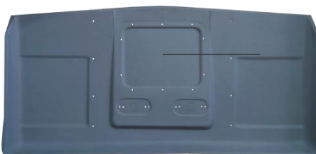
هيكل تغليف السقف - ٥٣٢٠-٥٧٠٢٠٨٣