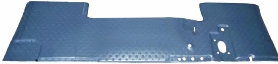
٥٣٢٠-٥١٠٩٠١٢ / ٦٥٢٠-٥١٠٩٠١٢ - سجاد الأرضية الخلفية