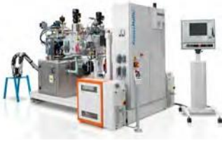
آلة رش رغوة البولي يوريثان المليئة بالزجاج "كراوس مافي" - ١ وحدة.