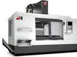
مركز المعالجة بالفارزة بالتحكم الرقمي HMS VF-8