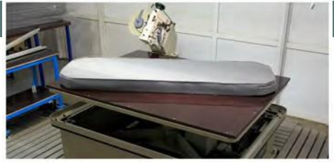
آلة الشد نوع شبه الثلثاني عدد ١