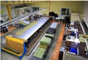
ورشة خياطة مجهزة ب٢٢ ماكينة خياطة