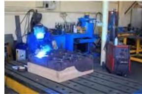
منطقة الإصلاح الميكانيكية