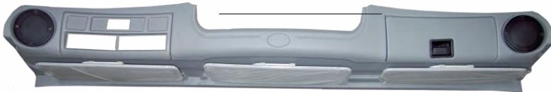
رف فوق النافذة - ٤٥٦٠٠٥٧٠٢٣٠٨