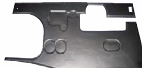
٦٥١١٥-٥٣٠٢٠٢٤ تغليف الجانب الأمامي الأيمن