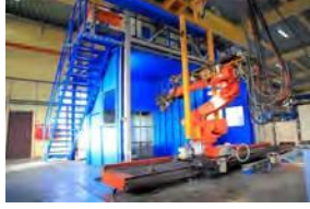
آلة رش الجرات ذات الضغط العالي "هينيك" - ١ وحدة