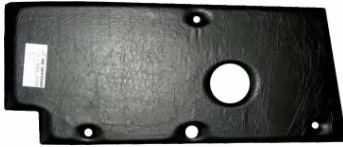
٥٣٢٠٥٠٥٣٠٢٠٢٧ تغليف الجدار الداخلي الامامي (على اليسار)