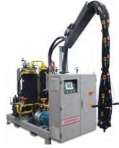
آلات تعبئة الرغوة ذات الضغط العالي "سابوب" إيطاليا- ٨ وحدات