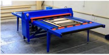
رقعة ضغط للقص عدد: ٢