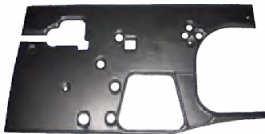
٦٥١١٥-٥٣٠٢٠٢٣ تغليف الجانب الأمامي اليساري