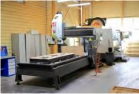
مركز المعالجة بالفارزة بالتحكم الرقمي HMS GR-510