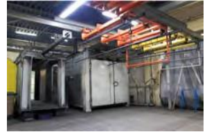
الخط شبه الآلي لمسحوق الطلاء