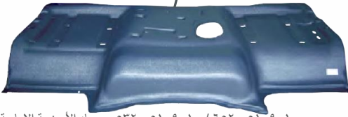
سجاد الأرضية الأمامية ٥٣٢٠-٥١٠٩٠١٠ / ٦٥٢٠-٥١٠٩٠١٠