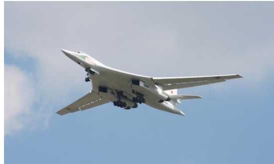
Flugzeug Tu-160 im Flug