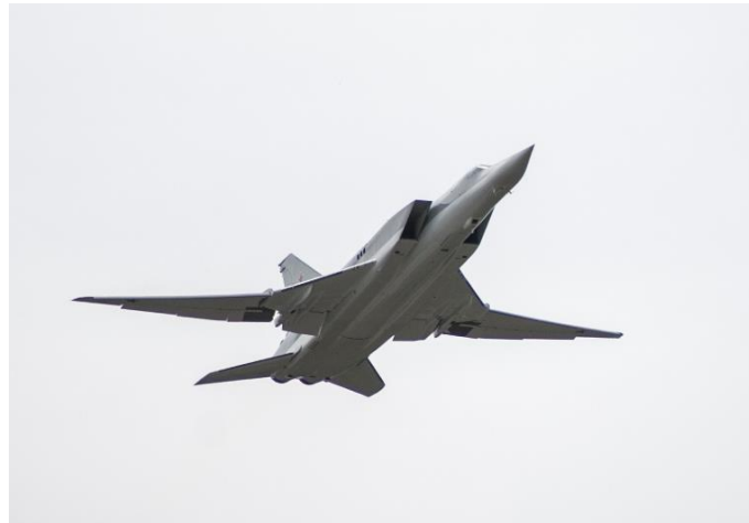
Flugzeug Tu-22M3 im Flug