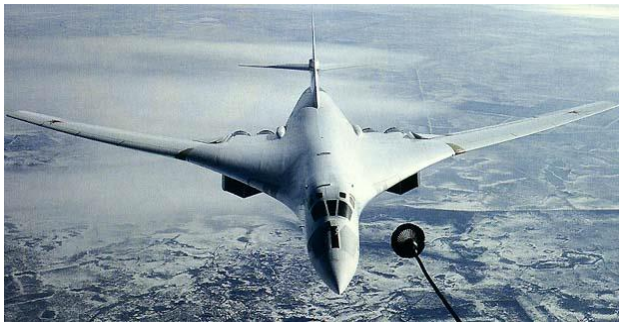
Tu-160 erfüllt die Betankung in der Luft