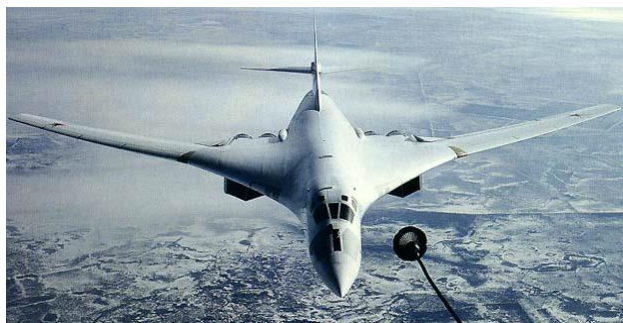
Ту-160 күктә ягулык белән тәэмин итә