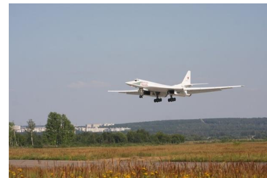
Ту-160 самолетының күтәрелүе