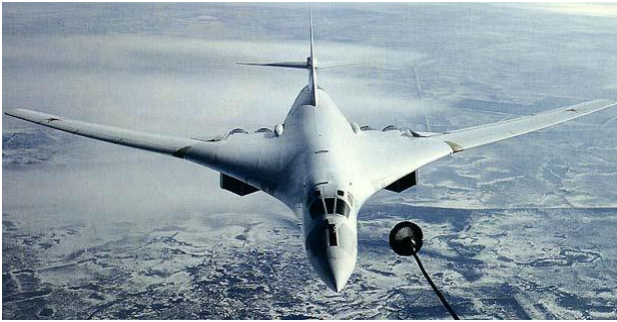
طائرة تو - 160 تقوم بالتزويد بالوقود في السماء