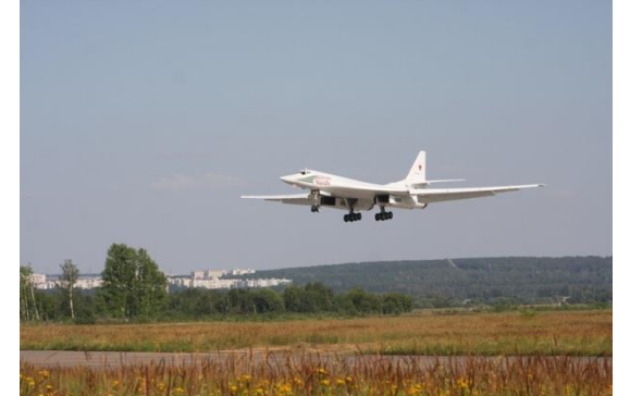
تحليق طائرة تو - 160