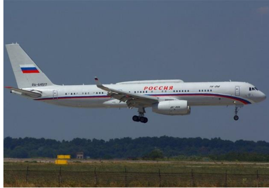
زودت طائرة تو 214 ب و لأغراض خاصة بنظام تحكم مثبت