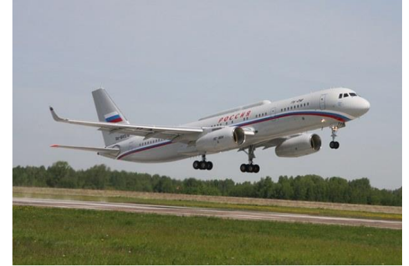
زودت طائرة تو - 214 س ر لأغراض خاصة بجهاز إعادة الإرسال

طائرة تو - 214 س و س - طائرة ذات أغراض خاصة مجهزة بوحدة اتصال ووسائل فنية خاصة تسمح لها بالتواصل مع أي نقطة في العالم أثناء الطيران