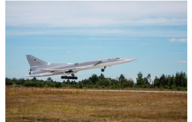
تو - 22 م 3 أثناء الإقلاع