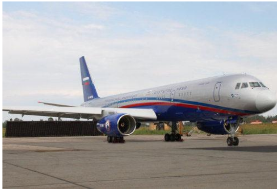
Tu-214 ON es un avión de propósito especial con el sistema de observación aérea instalado de cielo abierto

Después de haber demostrado su buen funcionamiento, el Tu-214 fue elegido como la base para la creación de una serie de aviones de propósito especial.