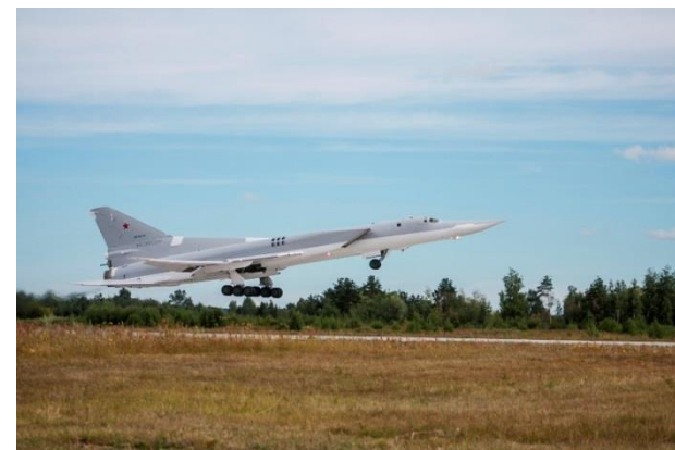
Despegue del avión Tu-22M3