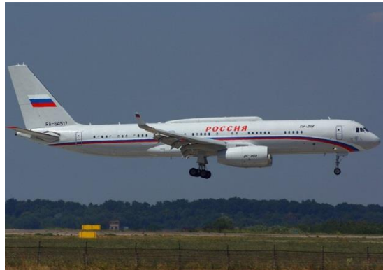
Tu-214 PU es un avión de propósito especial con puntos de control instalados