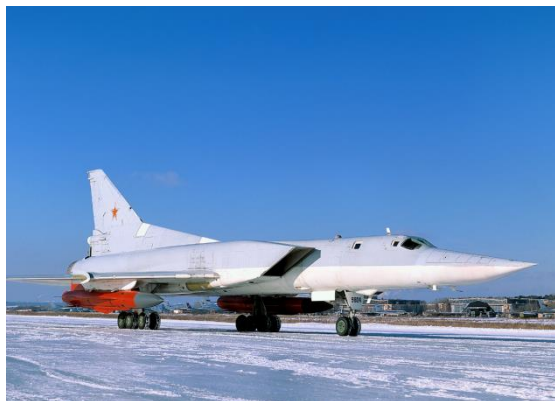
Tu-22M3 en la estación de prueba de vuelo