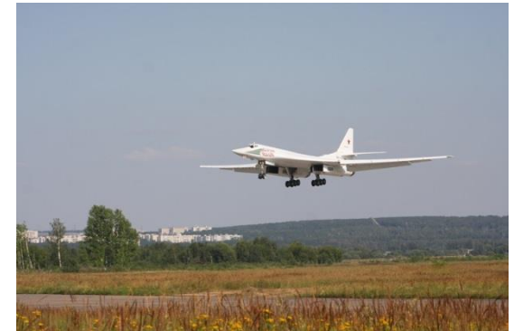
Despegue del avión Tu-160