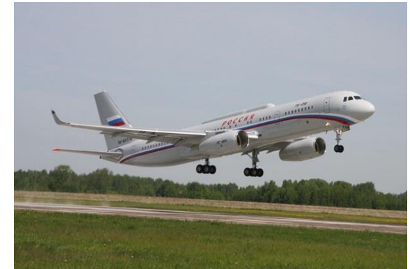
Tu-214 SR es un avión de propósito especial con repetidor

Tu-214SUS es un avión de propósito especial equipado con un nodo de comunicación y medios técnicos especiales que permiten comunicarse con cualquier punto del mundo en la ruta de vuelo.