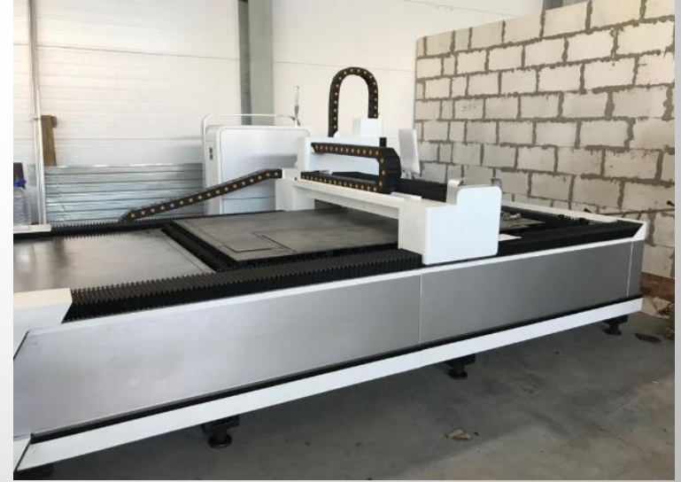
BODOR E1530-1500W lazer metal kesimi