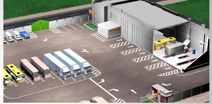
Yeni güvenli otopark