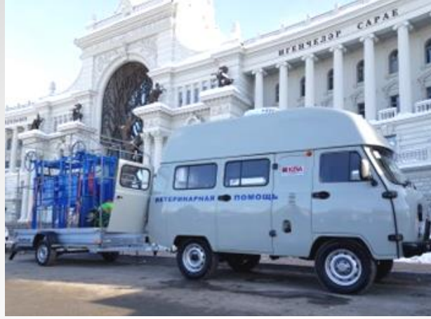
UAZ tabanlı mobil veteriner kliniği