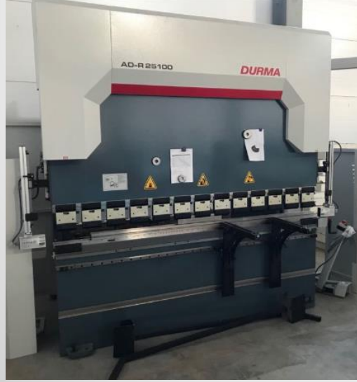
Durma AD-R 25100 serisi bükme presi