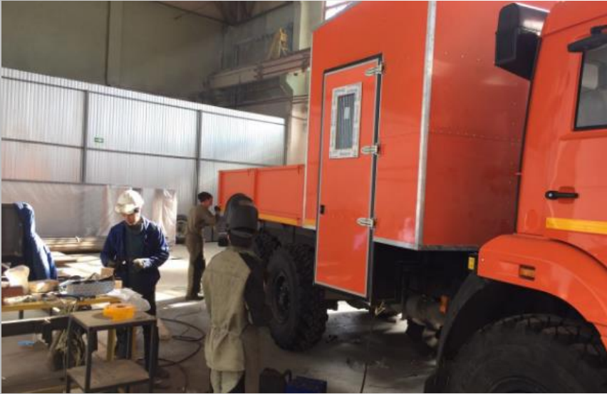
Gövde montaj bölümü