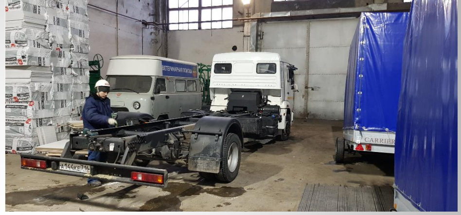
Şasi sonlandırma bölümü