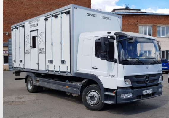
At taşıma minibüsü