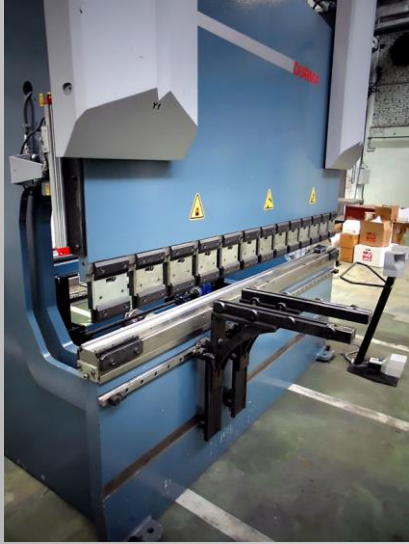
Durma AD-R 25100 serisi bükme presi