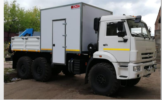
Yük ve yolcu araçları