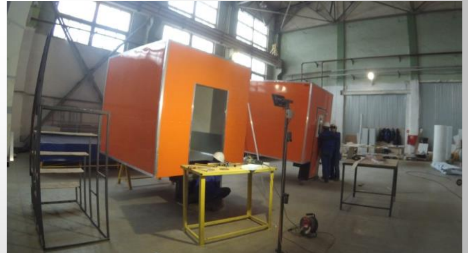
Eklenti montaj alanı