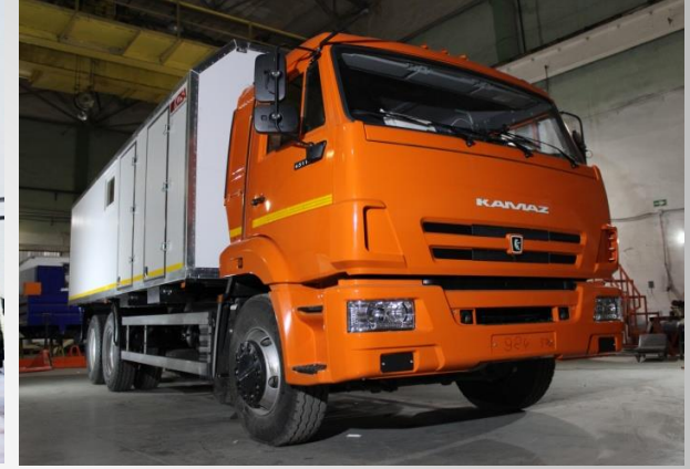
Mobil kontrol noktaları