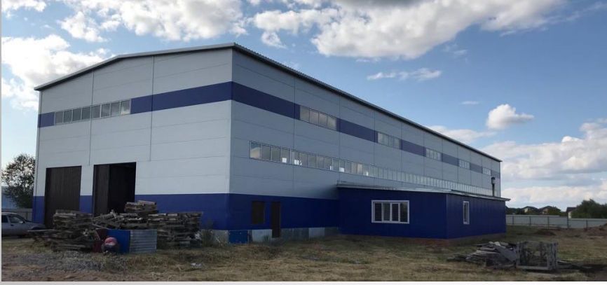
Yeni üretim atölyesi(1200 m 2 )