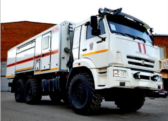
Acil kurtarma araçları