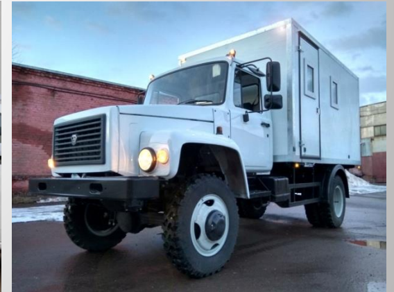
Özel amaçlı minibüsler