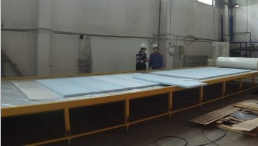
Sandviç panel üretimi