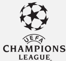
Champions League UEFA Europäische Liga

LIEFERANT VON KARTEN-PASSIERSYSTEMEN FÜR DIE SPORTANLAGEN DER FUßBALL-WELTMEISTERSCHAFT 2018