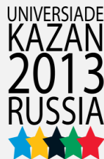
XXVII. Sommeruniversiade 2013