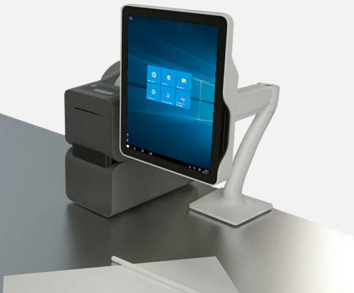
Rechnergestützter Arbeitsplatz der Behandlungsschwester