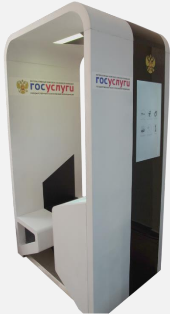
Kabine der öffentlichen Dienstleistungen

EINZIGARTIGE LÖSUNGEN AUF DEM GEBIET DER FERNBEDIENUNG