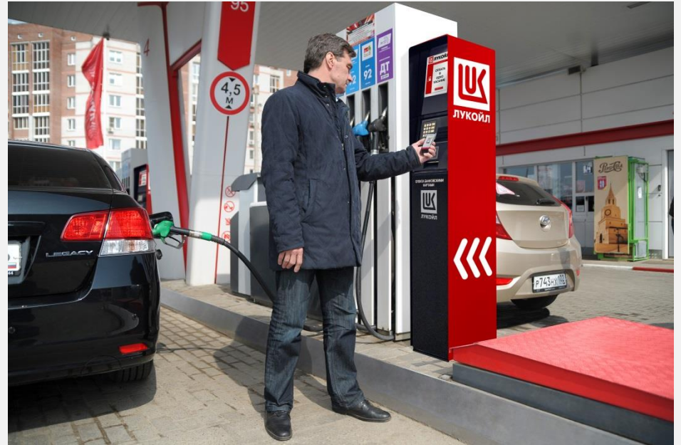
Terminals für die unbare Bezahlung der Dienstleistungen von Tankstelle