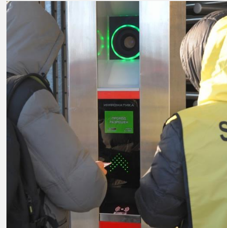
Systeme der Video-Identifizierung