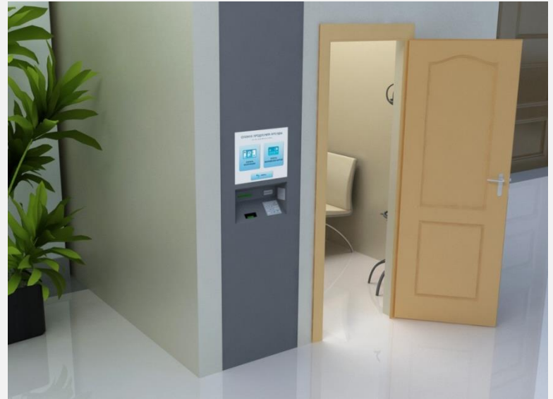
Kabine für die gegenseitigen Abrechnungen