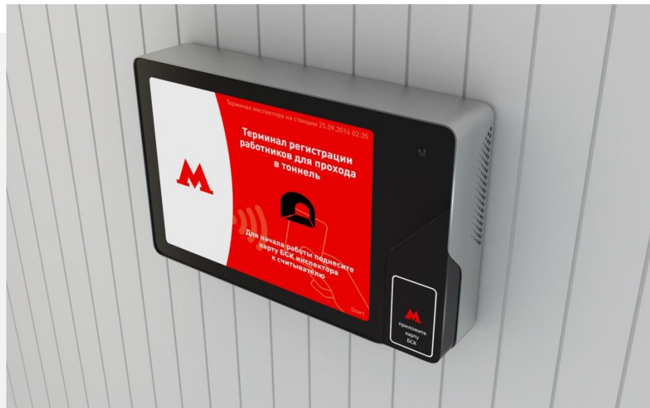
Rechnergestützter Arbeitsplatz – Kontrollsystem des Durchgangs in den Untergrundbahntunnel