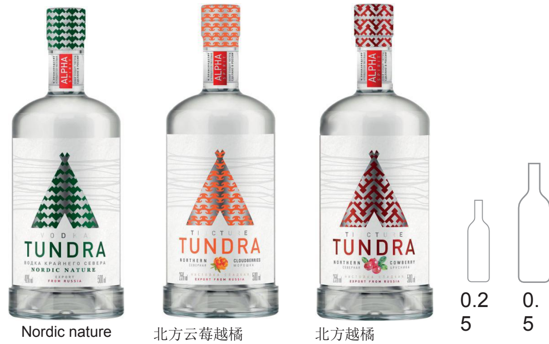
Nordic nature 北方云莓越橘 北方越橘